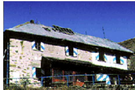
Rifugio Grassi (m 1.987)

Il Rifugio Madonna della Neve e l'annessa chiesetta sono situati nel cuore della Val Biandino e risalgono al 1664.